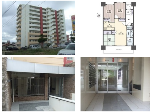
【バス停】第一佐真下／徒歩約1分