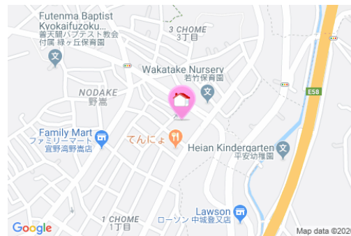
【バス停】野嵩1丁目／徒歩約2分