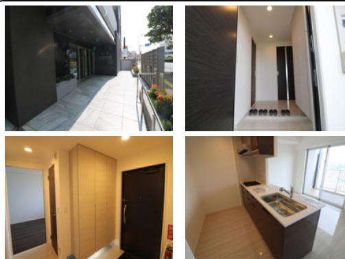
【バス停】牧港郵便局入口／徒歩約3分