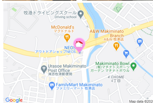
【バス停】 牧港郵便局入口 / 徒歩約3分