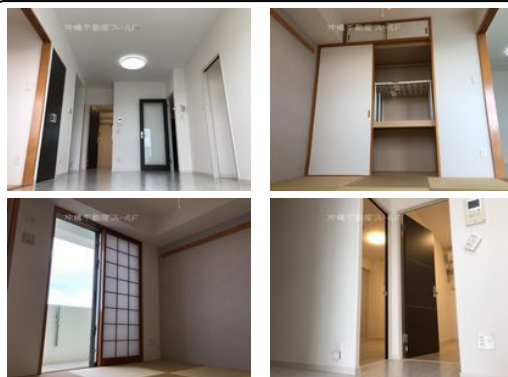
【バス停】第一佐真下／徒歩約1分