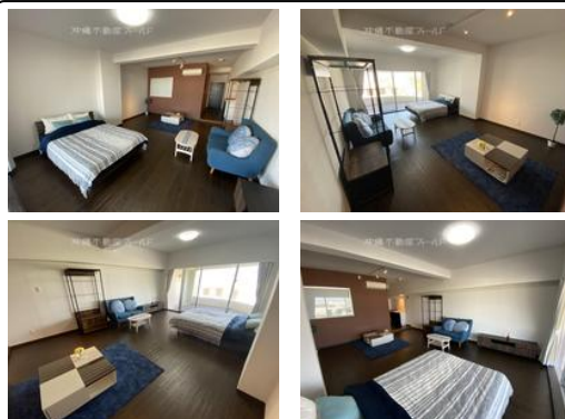
【バス停】仲泊／徒歩約12分