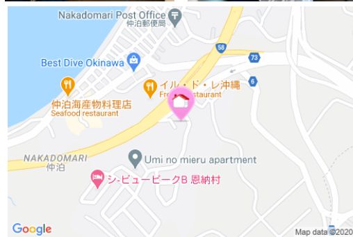
【バス停】仲泊／徒歩約12分