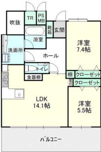
※現状と異なる場合は、現状を優先します。