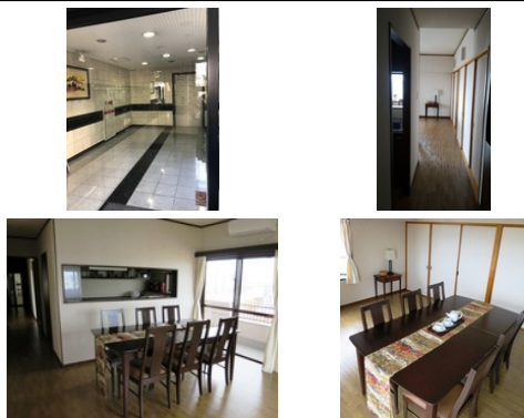
【モノレール】美栄橋駅 / 徒歩約12分