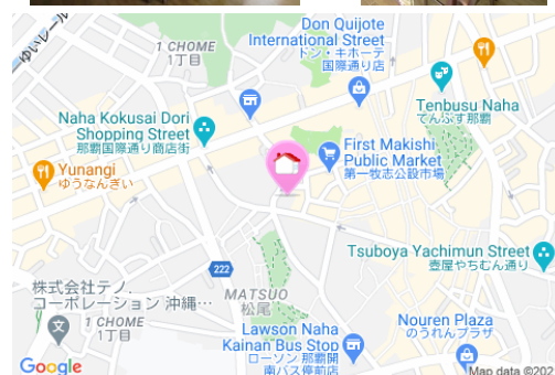
【モノレール】美栄橋駅 / 徒歩約12分