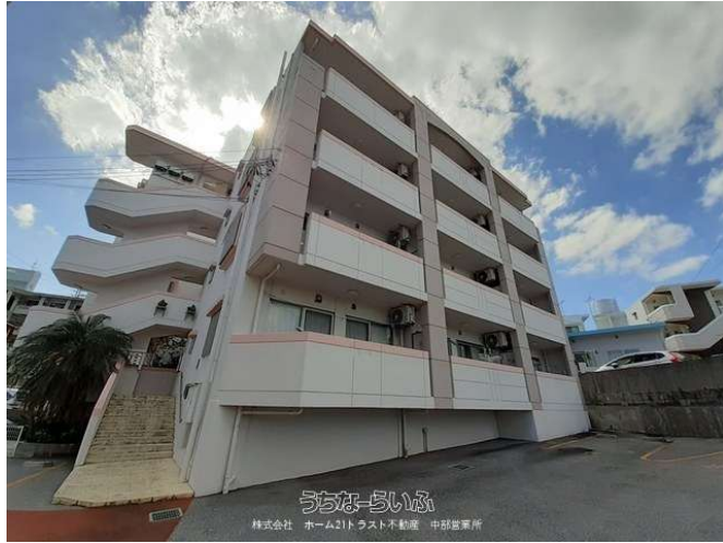
うちなーらいつ 株式会社 ホーム21トラスト不動産 中部営業所

再募集！内見可★沖縄病院近くの住宅街♪ネット無料・対面システムキッチン・エアコン・温水洗浄便座付で住設備充実♪【初期費用等は下記備考欄】#退去済⇒6月中旬入居可能予定