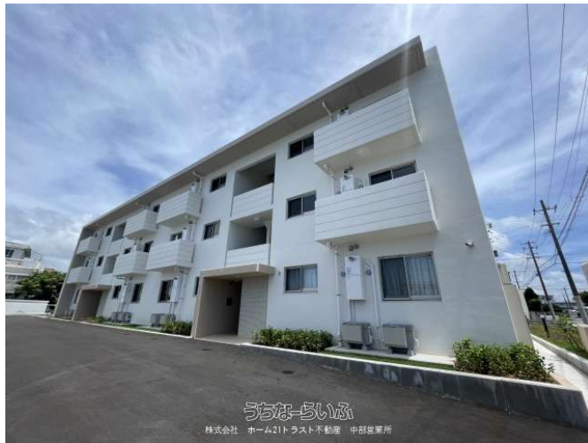
うちなーらいふ 株式会社 ホーム21トラスト不動産 中部営業所