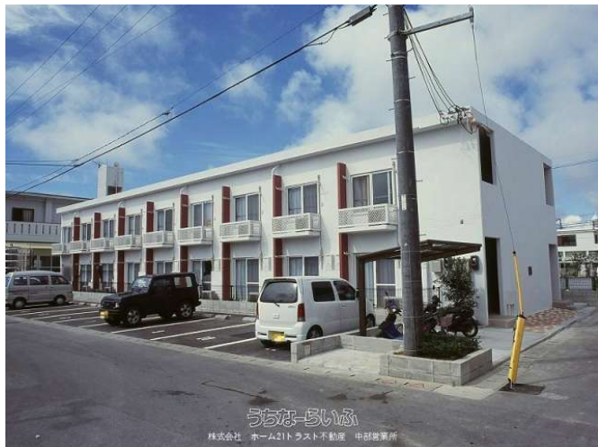
うちなーらいふ 株式会社 ホーム21トラスト不動産 中部営業所

防犯カメラ付で安心！宮里中近く区画整理地で利便性の良い住宅街♪家具家電付き&住設備充実♪水道料は共益費込み！【初期費用の詳細は下記備考欄参照】連帯保証人不要&電子契約でスムーズ契約&入居！