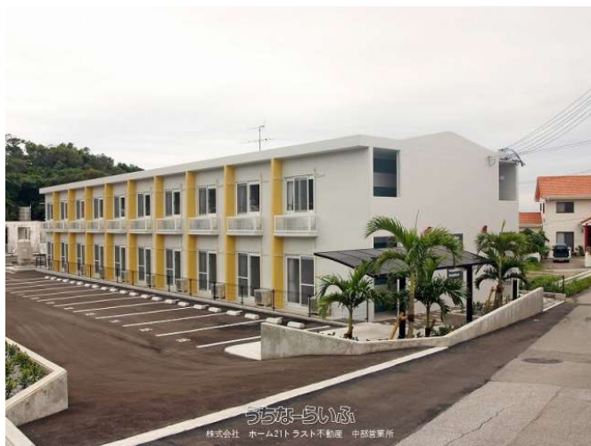
株式会社 ホーム21トラスト不動産 中部営業所

具志川中近くで交通便利性良し◎家具家電付き&住設備充実♪水道料は共益費込み&駐車場有り!【初期費用の詳細は下記備考欄参照】セキュリティ設備完備★連帯保証人不要&電子契約でスムーズ契約&入居!