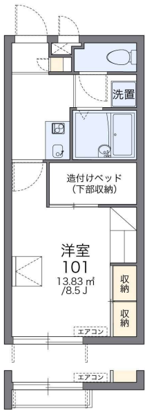
※2階 フラワーボックス有り

☆家具家電付き!!☆初期費用の詳細は下記備考欄をご確認下さい☆付近物件もお探しの方は是非ハウステラまでご連絡ください♪