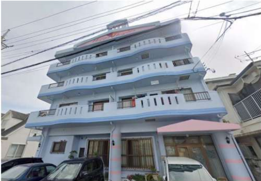
うちなーらいいふ

☆≡3LDK×角部屋。家族でのんびり暮らせるエリア！バルコニーから光と風が気持ちいい！！お気軽にお問い合わせ下さい♪※現況優先。写真及び動画は別室を参考に掲載しています。【10月末退去予定の為、内見はご相談ください！】