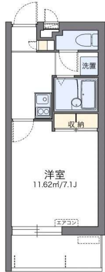
うちなーらいいふ

那覇市天久家具家電付き1Kです★お二人でのご入居もご相談ください。おもろまち駅までの距離は徒歩23分となります。