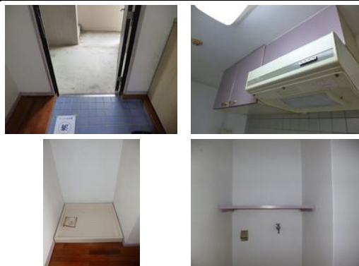
【バス停】南板良敷 / 徒歩約2分