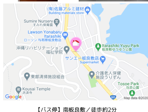
【バス停】南板良敷 / 徒歩約2分