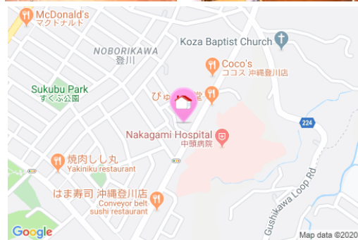
【バス停】農研研修センターバス停 / 徒歩約15分