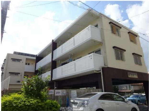
ファミーユ・アユレ

内覧可能です！ 儀保駅徒歩2分の好立地！ 駐車場縦列2台可能（縦列）、ネット無料・ガス衣類乾燥機・対面式キッチン☆日当たり良好の南向き最上階角部屋ですヨ！