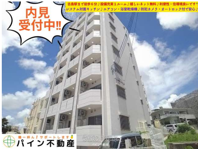
古島駅まで徒歩6分♪設備充実1ルーム♪嬉しいネット無料♪利便性・住環境良いです♪システム対面キッチン♪エアコン・浴室乾燥機♪防犯カメラ・オートロック付で安心♪