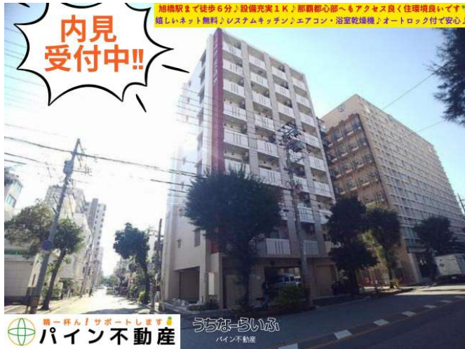
旭橋駅まで徒歩6分♪設備充実1K♪那覇都心部へもアクセス良く住環境良いです♪嬉しいネット無料♪システムキッチン♪エアコン・浴室乾燥機♪オートロック付で安心♪