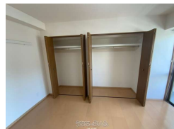
【モノレール】おもろまち駅／徒歩約6分