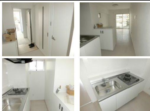
【モノレール】旭橋駅/徒歩約7分