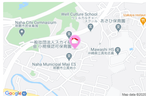
【バス停】識名団地入口/徒歩約6分