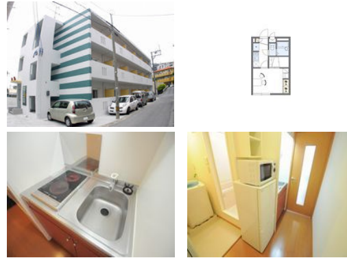
【モノレール】古島駅／徒歩約12分