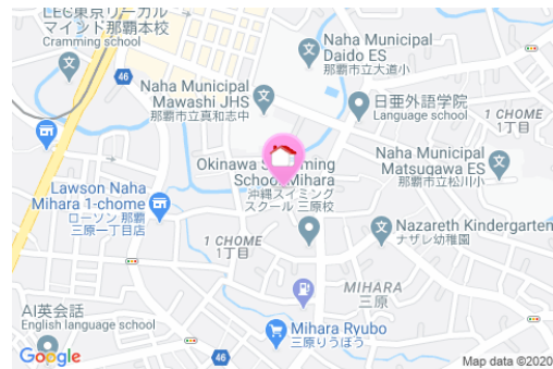
【モノレール】安里駅／徒歩約8分