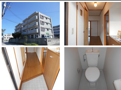
【バス停】石川入口/徒歩約15分