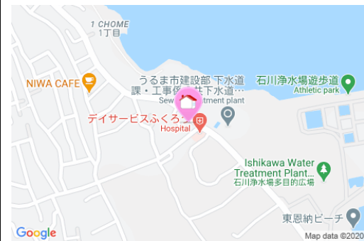
【バス停】石川入口/徒歩約15分