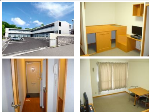
【バス停】北谷老人福祉センター前／徒歩約16分