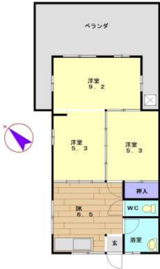
【嘉数アパートA-1号室】

バス・トイレ別。3DKベランダ広々★駐車場（軽）1台込・角部屋です。 2台目駐車場空き要確認（別契約7,000円）