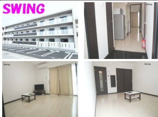
【バス停】第二真栄原 / 徒歩約7分