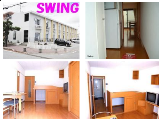
【バス停】県総合運動公園前：徒歩約6分