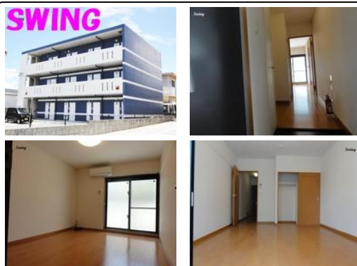
【バス停】宮里中学校前バス停／徒歩約4分