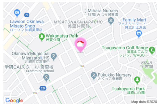
【バス停】宮里中学校前バス停／徒歩約4分