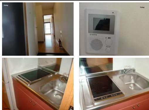
【バス停】明道バス停／徒歩約10分