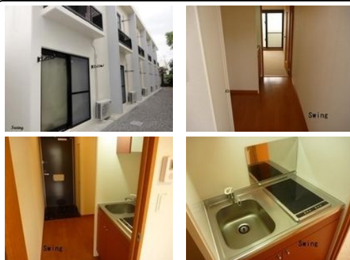
【バス停】野嵩1丁目／徒歩約3分