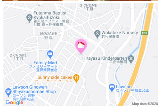
【バス停】野嵩1丁目／徒歩約3分