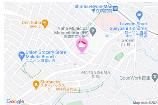
【モノレール】市立病院前駅／徒歩約5分