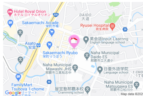
【モノレール】安里駅／徒歩約10分