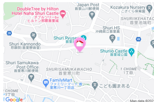
【モノレール】儀保駅／徒歩約15分