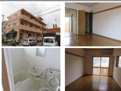
【バス停】比 屋 根 / 徒歩約5分