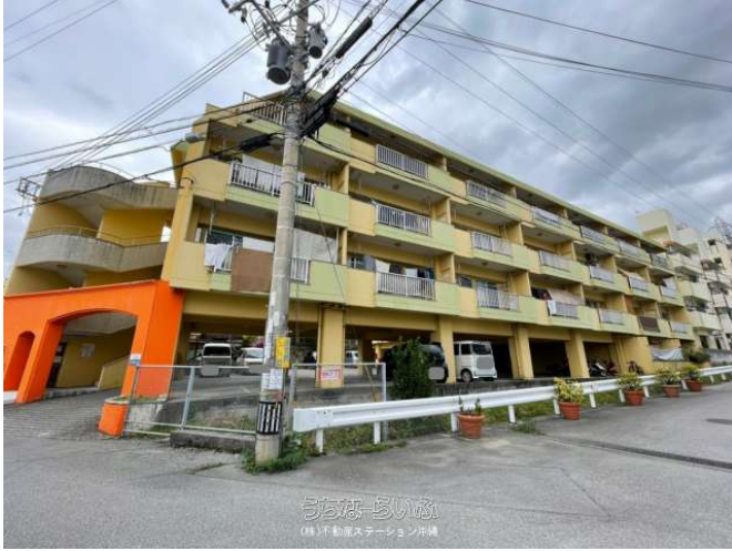
パラシオいずみはら (株)不動産ステーション沖縄

パラシオいずみはら★那覇市字小禄エリア『礼金ナシ!』駐車場有り! 閑静な住宅街・交通便利・2DKタイプ商業施設近く! 使いやすい和洋タイプでファミリー様にオススメのお部屋です♪