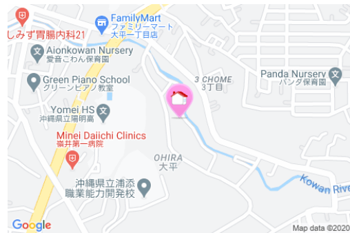
【バス停】宮城入口/徒歩約11分