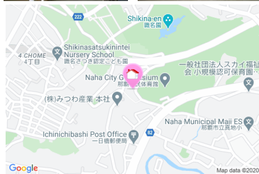
【バス停】那覇市立体育館前／徒歩約5分