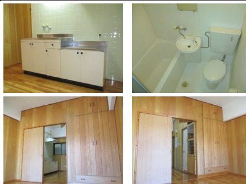
【バス停】翁長ノ徒歩約5分