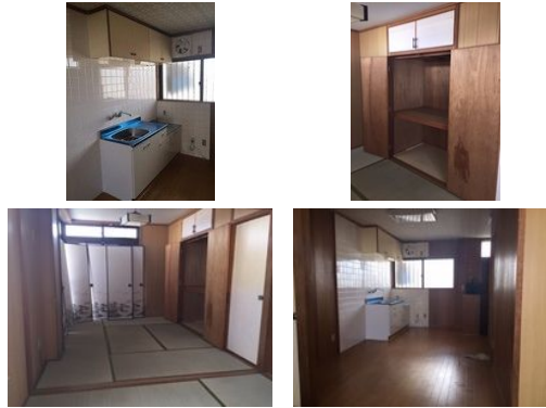
【バス停】宇栄原／徒歩約5分