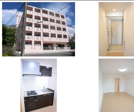
【バス停】大平ノ徒歩約2分