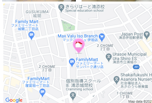
【バス停】浦添小学校入口／徒歩約2分